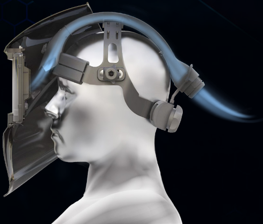
Hoofddeksel met luchtstroomregeling