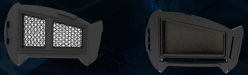
Gas filter Q4 2022 | A1B1E1K1