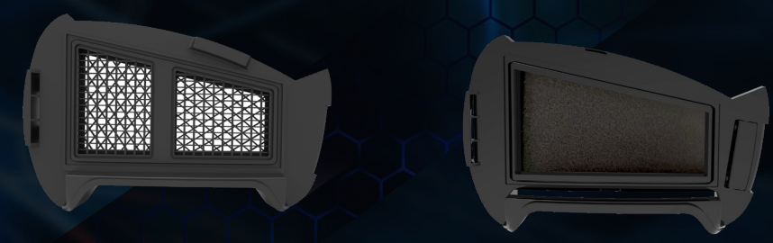
Gas filter Q4 2022 | A1B1E1K1